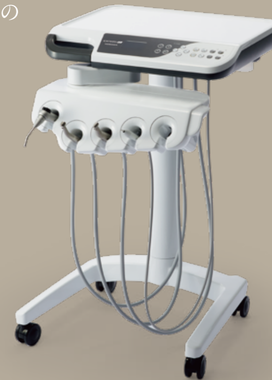
3型:カート 写真はオプション装備例