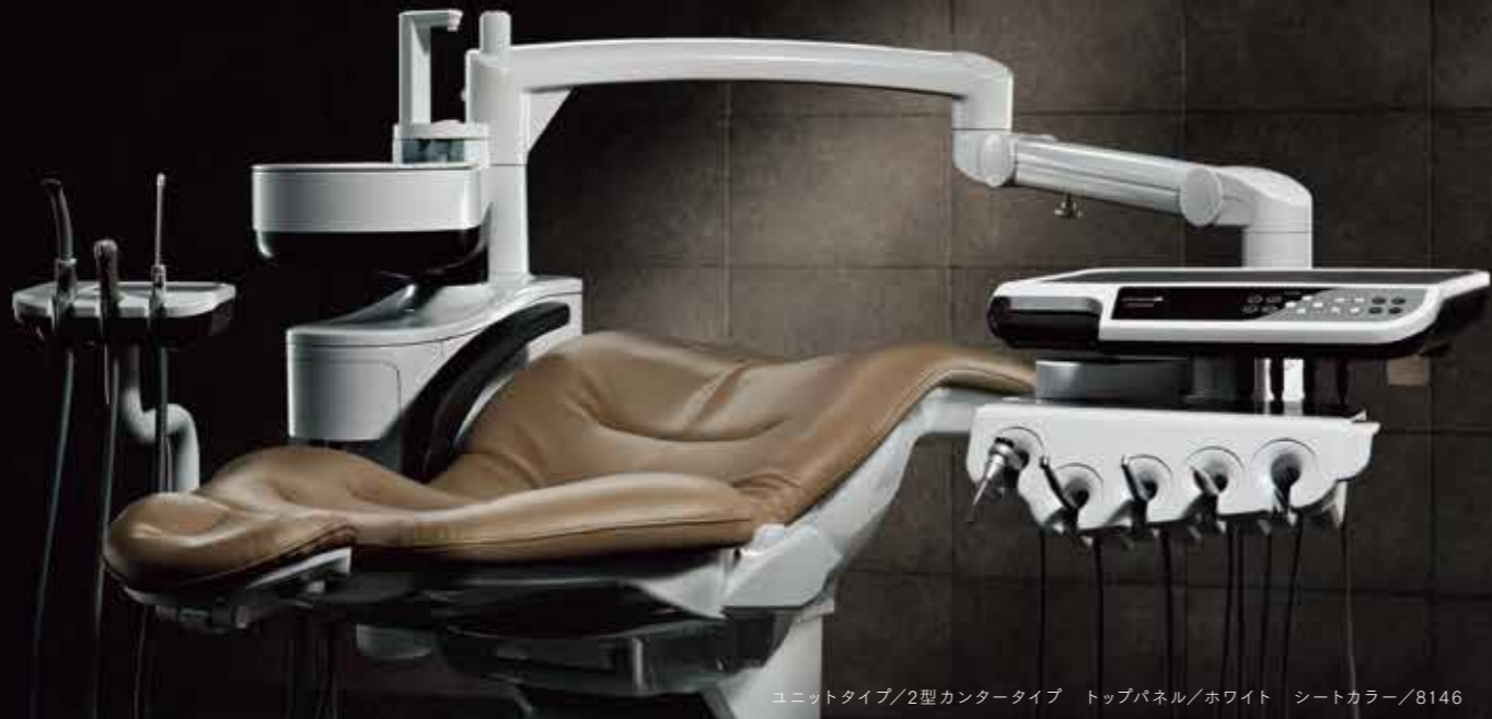
ユニットタイプ/2型カンタータイプ トップパネル/ホワイト シートカラー/8146