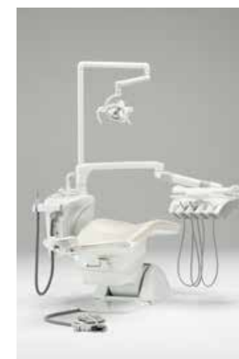
2型:カンタータイプ