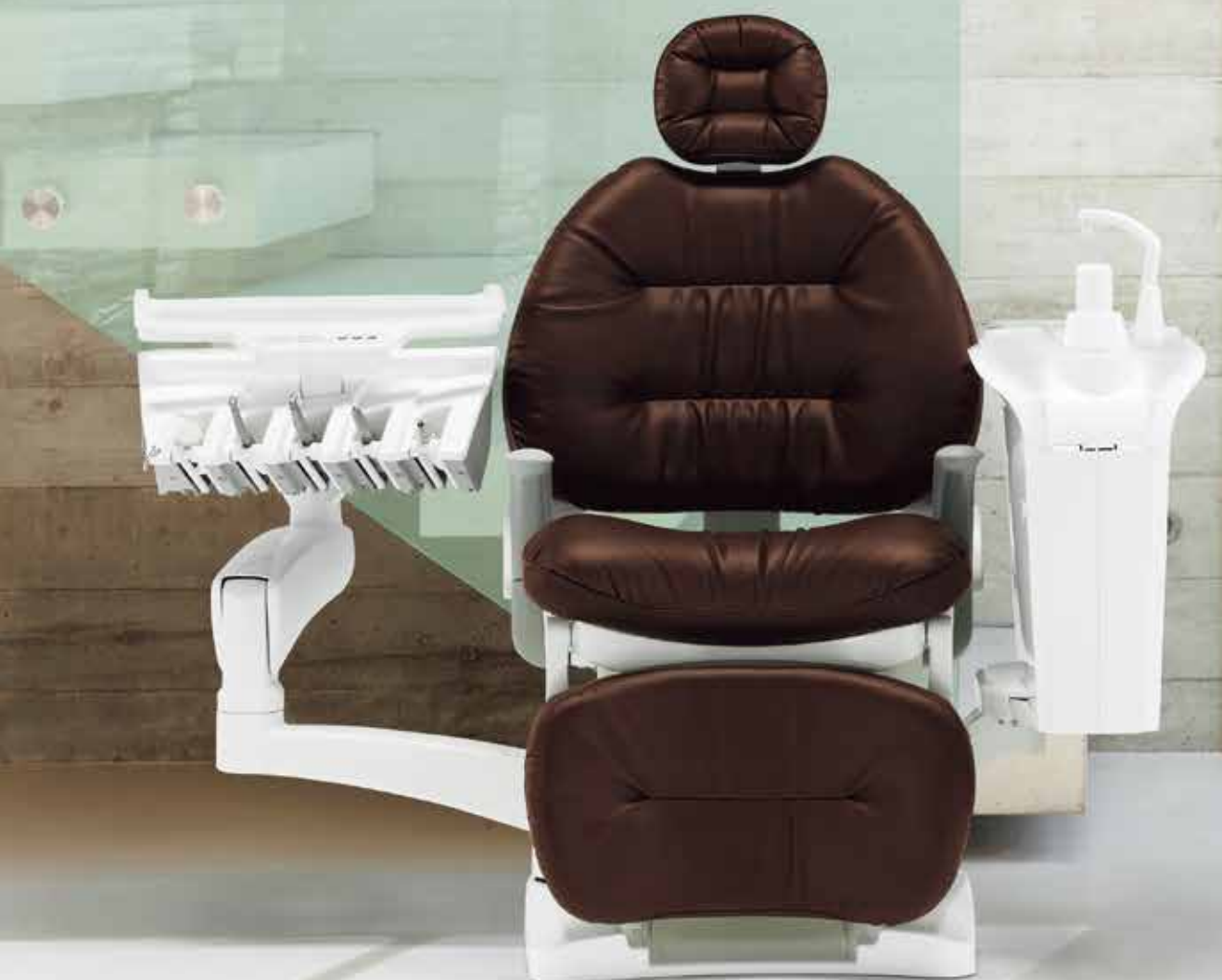
写真はオプション装備例